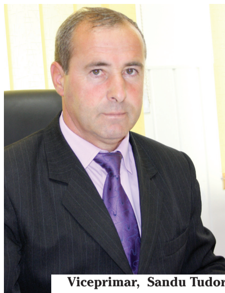
Viceprimar, Sandu Tudor

Autoritățile sunt hotărâte să ia măsuri dure